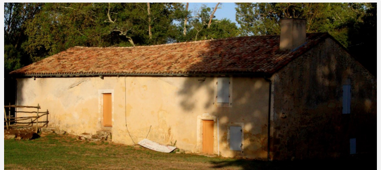
Changement menuiseries du Moulin du Mayne