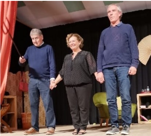
Théâtre Du 30/04/2022