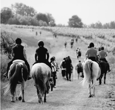
Randonnée des Benauges Du 04/06/2022