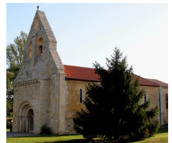
Réfection de la toiture de l'Eglise St Martin