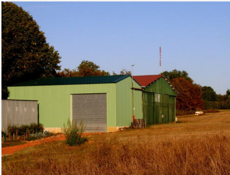
Construction de l'atelier communal au Mayne