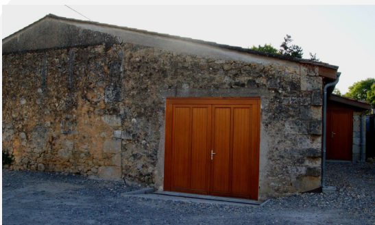
Aménagement d'un local associatif