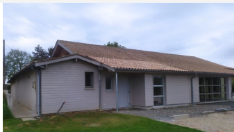
Construction d'un toilette public salle des Platanes