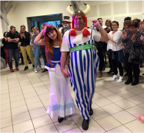
Carnaval Du 19/03/2022