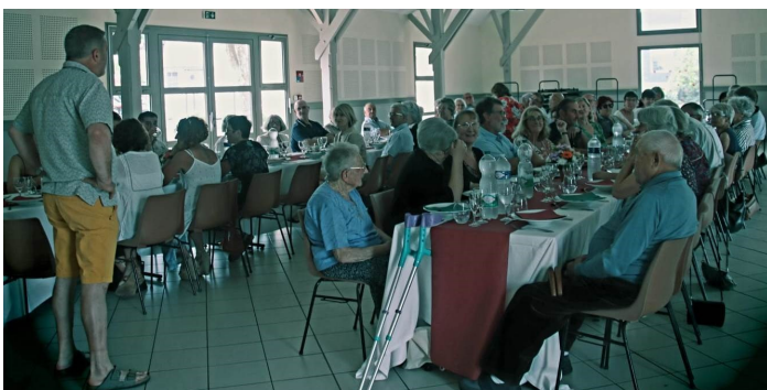
Repas communal Du 21 mai 2022