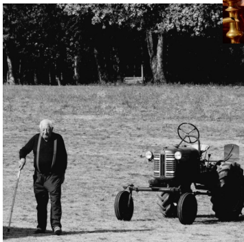
Marché des Producteurs Du 18 septembre 2022