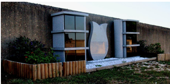
Columbarium au cimetière Aux Champs de Gouas