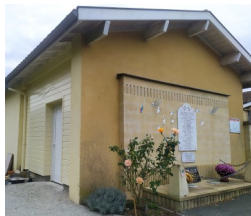
Construction d'un toilette public derrière le Monument aux Morts, quartier Arbis