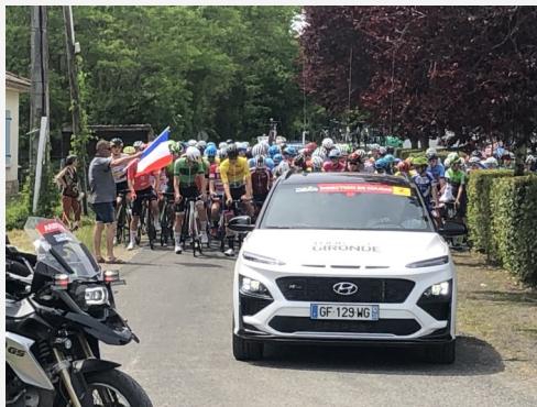
Tour de Gironde Du 14/05/2022