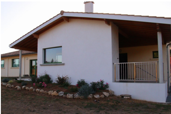
Construction d'un barbecue à la salle Yvonne Domez