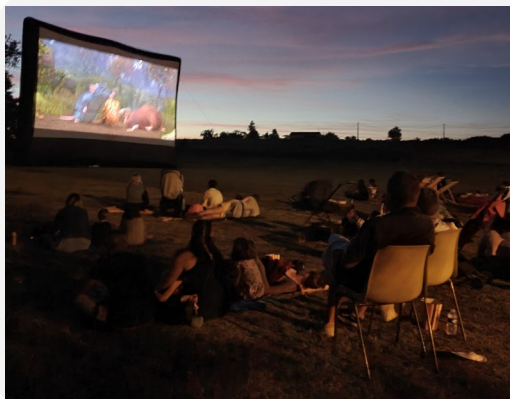
Cinéma plein air & Feu d'artifice Du 14 juillet 2022