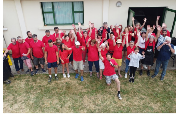
Pétanque du 25/06/2022 (Pas de photos)