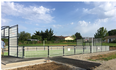
CITY STADE quartier Cantois