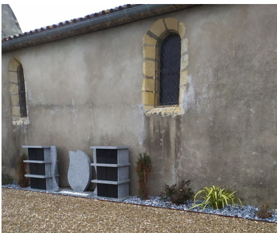
Ornement columbarium St Seurin