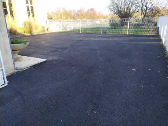
Parking arrière mairie