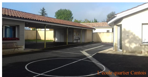
L'école quartier Cantois

130 Le Bourg-Cantois—33760 PORTE-DE-BENAUGE 09.82.12.20.28 - sirplaces@gmail.com