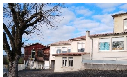
École de Soulignac