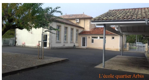
L'école quartier Arbis